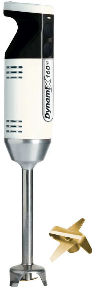
KOPAL DYNAMIX DMX 160 V2