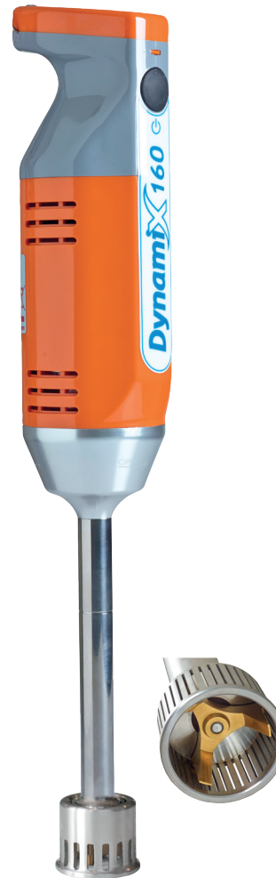
KOPAL DYNAMIX DMX 160 BLENDER