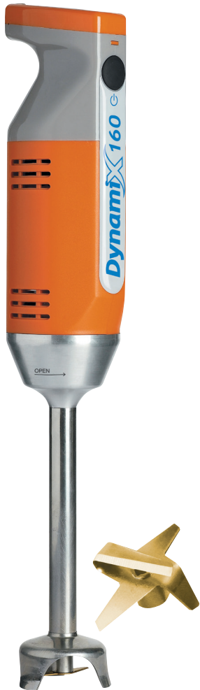
KOPAL DYNAMIX DMX 160